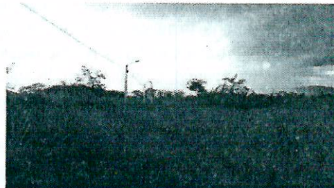
Fotografía 8. Cobertura de pastos en ASS

Es importante destacar que en el predio se encuentra una vivienda construida (Fotografía 9) la cual según se manifestó, corresponde a al sitio de residencia de las personas que cuidan del predio. Así mismo en el área ya se encuentran construidas otro tipo de infraestructuras que corresponderían al área social del proyecto Los Robles y que incluyen una piscina, así como otras viviendas en proceso de construcción (Fotografías 10 a 12) que hacen parte del proyecto propuesto por el peticionario.