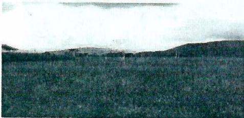
Fotografía 5. Cobertura de pastos en ASS

En cuanto a los atributos de área solicitada en sustracción, se encontró que similarmente a lo que se encuentra paisajísticamente en la zona, esta corresponde a una superficie en la cual dominan la cobertura de pastos limpios, como se puede observar en las fotografías 5 a 8, las cuales corresponden a vistas del predio desde un punto central. Igualmente, aunque en mínima proporción se observan individuos arbóreos y arbustivos aislados, que según indica el peticionario no serán objeto de remoción por tratarse de elementos paisajísticos de interés para el proyecto.