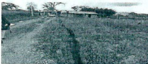
Fotografía 9. Vivienda en el ASS

Es importante destacar que en el predio se encuentra una vivienda construida (Fotografía 9) la cual según se manifestó, corresponde a al sitio de residencia de las personas que cuidan del predio. Así mismo en el área ya se encuentran construidas otro tipo de infraestructuras que corresponderían al área social del proyecto Los Robles y que incluyen una piscina, así como otras viviendas en proceso de construcción (Fotografías 10 a 12) que hacen parte del proyecto propuesto por el peticionario.