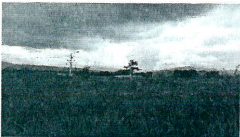
Fotografía 7. Cobertura de pastos en ASS