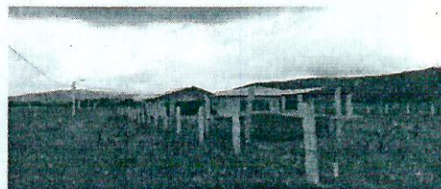
Fotografía 10. Infraestructura en construcción en el ASS