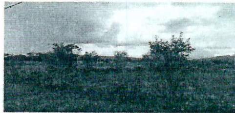
Fotografía 6. Cobertura de pastos en ASS