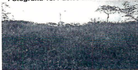
Fotografía 15. Pastos altos en el ASS.