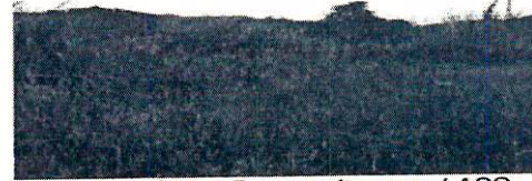
Fotografía 14. Pastos altos en el ASS.