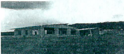
Fotografía 11. Infraestructura en construcción en el ASS