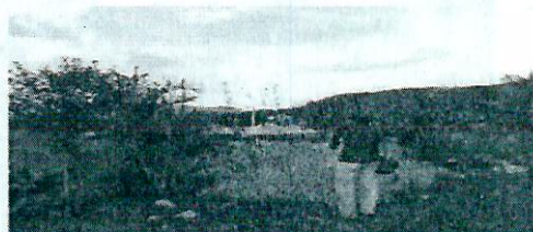
Fotografía 12. Infraestructura en construcción en el ASS