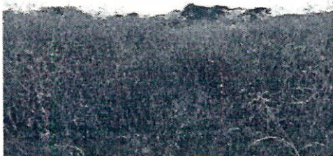
Fotografía 13. Pastos altos en el ASS.

Adicionalmente, se logró constatar que sobre el área no transcurren cuerpos de agua, más si se han implementado sistemas de conducción de aguas lluvias.