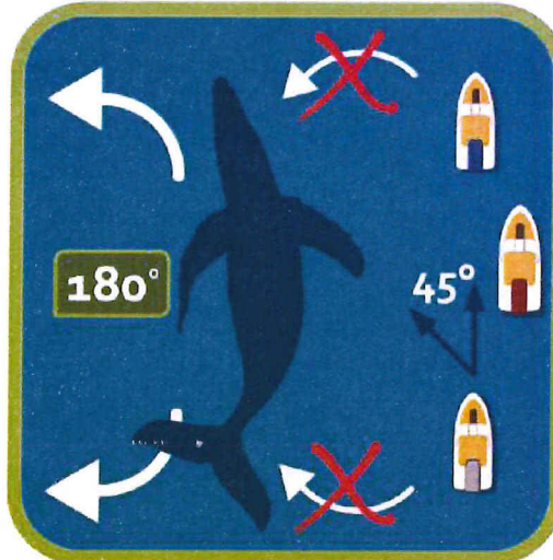
Figura 2: Ubicación y aproximación de embarcaciones para un correcto avistamiento.