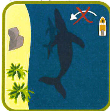
Figura 1: Ubicación de la embarcación con relación al mamífero marino.