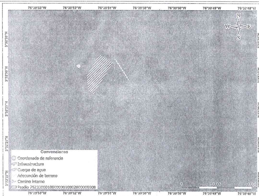
Imagen 6 Imagen satelital capturada el 16 de julio de 2020.

Adicionalmente, se aprecia la recuperación de pastos y la presencia de elementos arbustivos en la zona previamente removida en 2016, lo cual sugiere que dicha intervención no generó un cambio permanente en el uso del suelo, pues la cobertura original logró restablecerse de manera natural. En consecuencia, esta área no se considera como parte de los resultados del presente análisis.