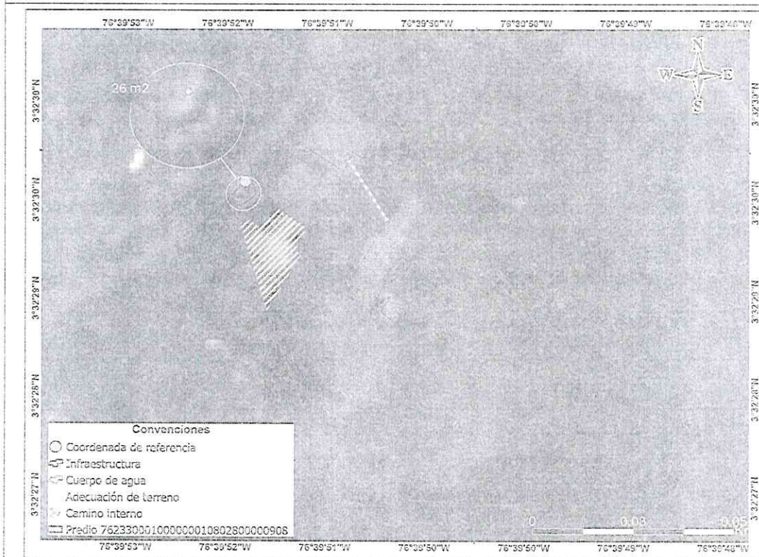
Imagen 8 Imagen satelital capturada el 19 de septiembre de 2024.

Salvo esta infraestructura, no se identifican otro tipo de intervenciones sobre el predio.