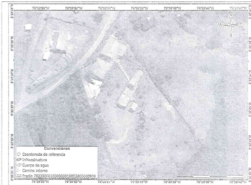
Imagen 7 Imagen satelital capturada el 18 de julio de 2023.

"Por medio del cual se declara el inicio de un procedimiento administrativo sancionatorio ambiental, se apertura el expediente SAN - 00306 y se adoptan otras disposiciones"