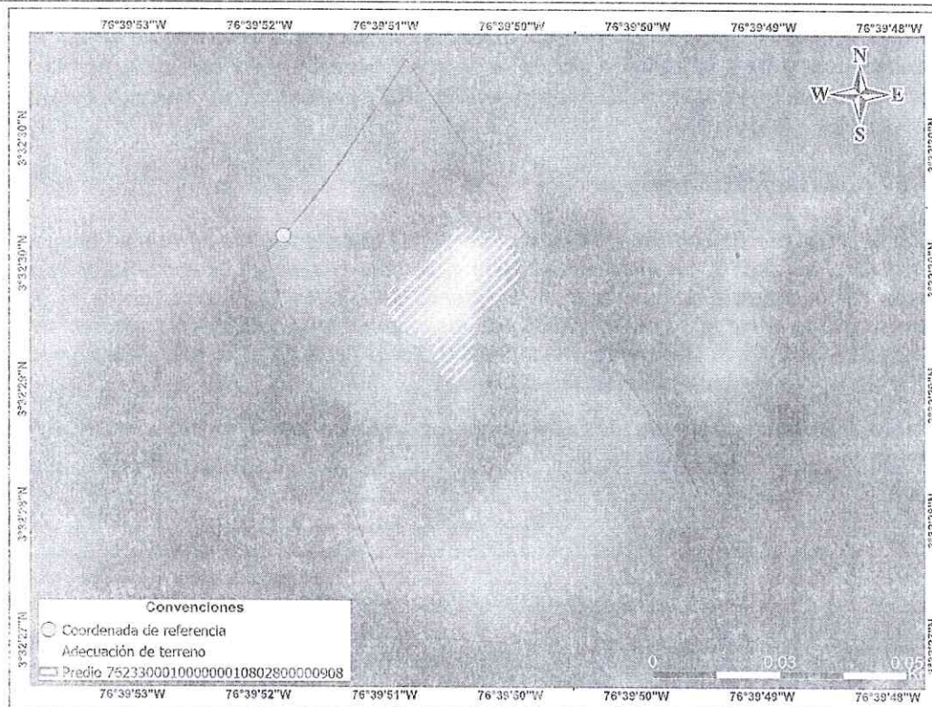
Imagen 3 Imagen satelital capturada el 25 de julio de 2015. Obtenido de Planet

Observaciones: El primer insumo satelital disponible para la zona corresponde al año 2011. Para esta fecha, el predio presenta una cobertura predominante de suelo desnudo, con presencia localizada de pastos en el sector suroriental. Se observa una adecuación de terreno de aproximadamente 439 m 2 , sin que sea posible establecer con exactitud el momento de su ejecución.