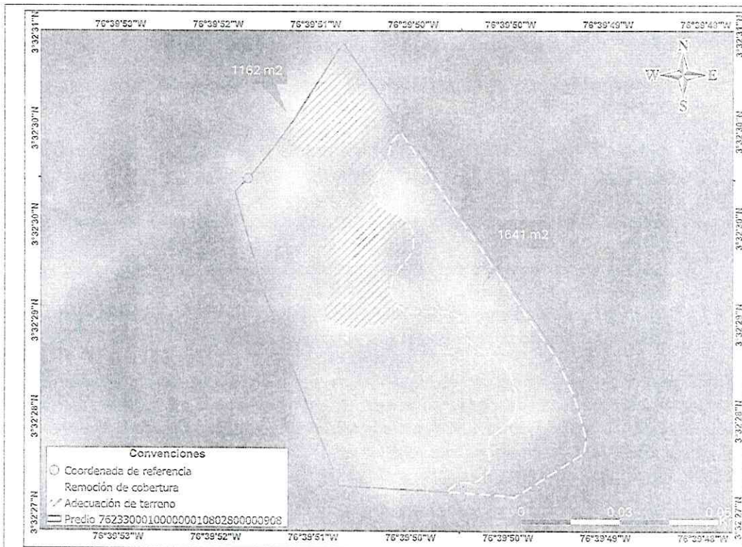
Imagen 4 Imagen satelital capturada el 09 de julio de 2016.

"Por medio del cual se declara el inicio de un procedimiento administrativo sancionatorio ambiental, se apertura el expediente SAN - 00306 y se adoptan otras disposiciones"