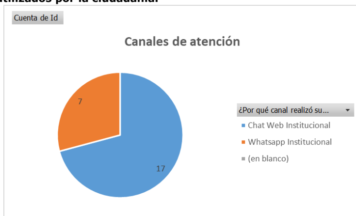
Ilustración 4. Canales utilizados por la ciudadanía.