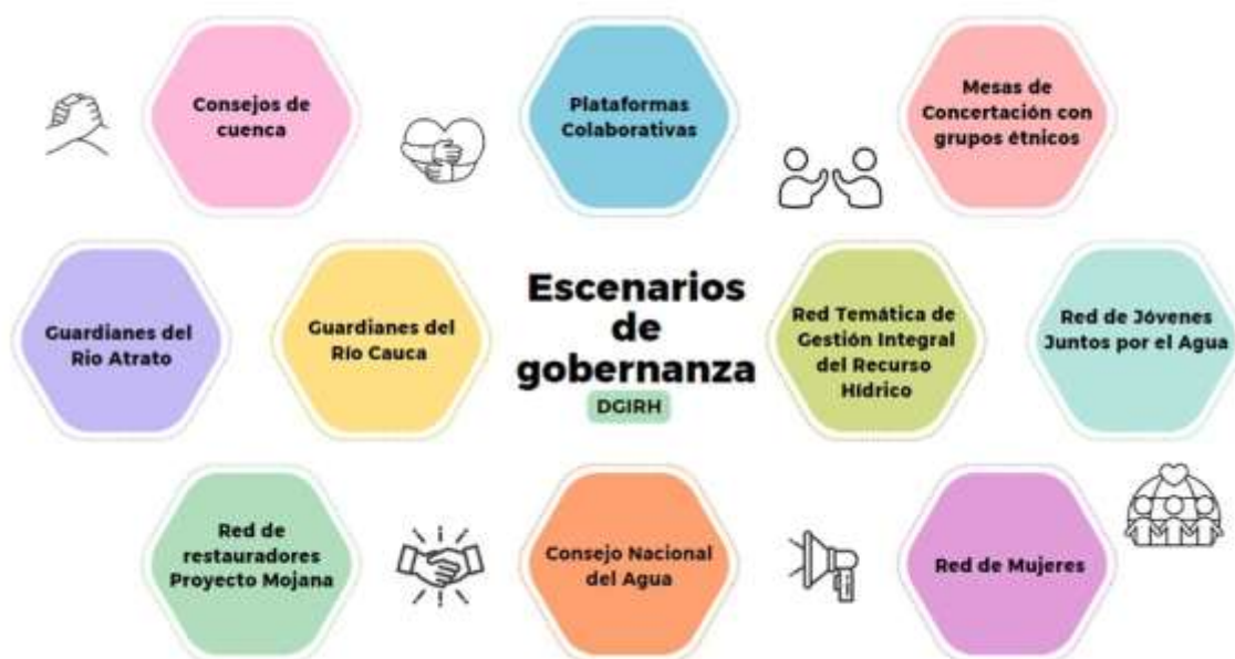
Figura 1: Escenarios de Gobernanza