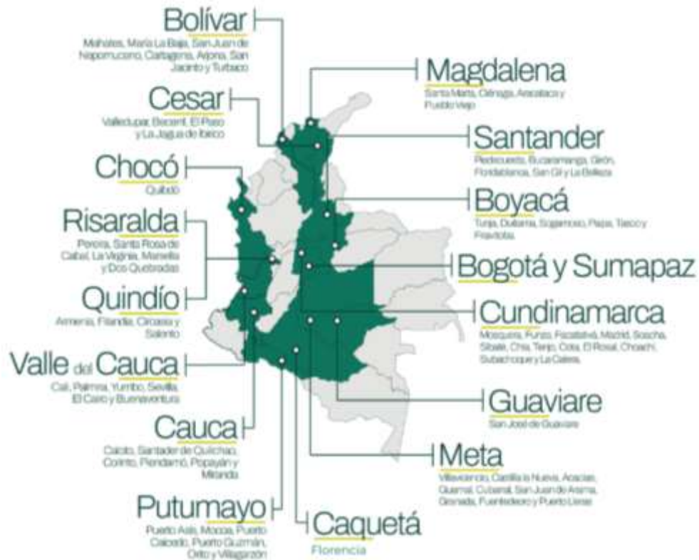
ILUSTRACIÓN 1. FIGURA INDICATIVA TERRITORIOS #ALERTAPORMIAMBIENTE 2026