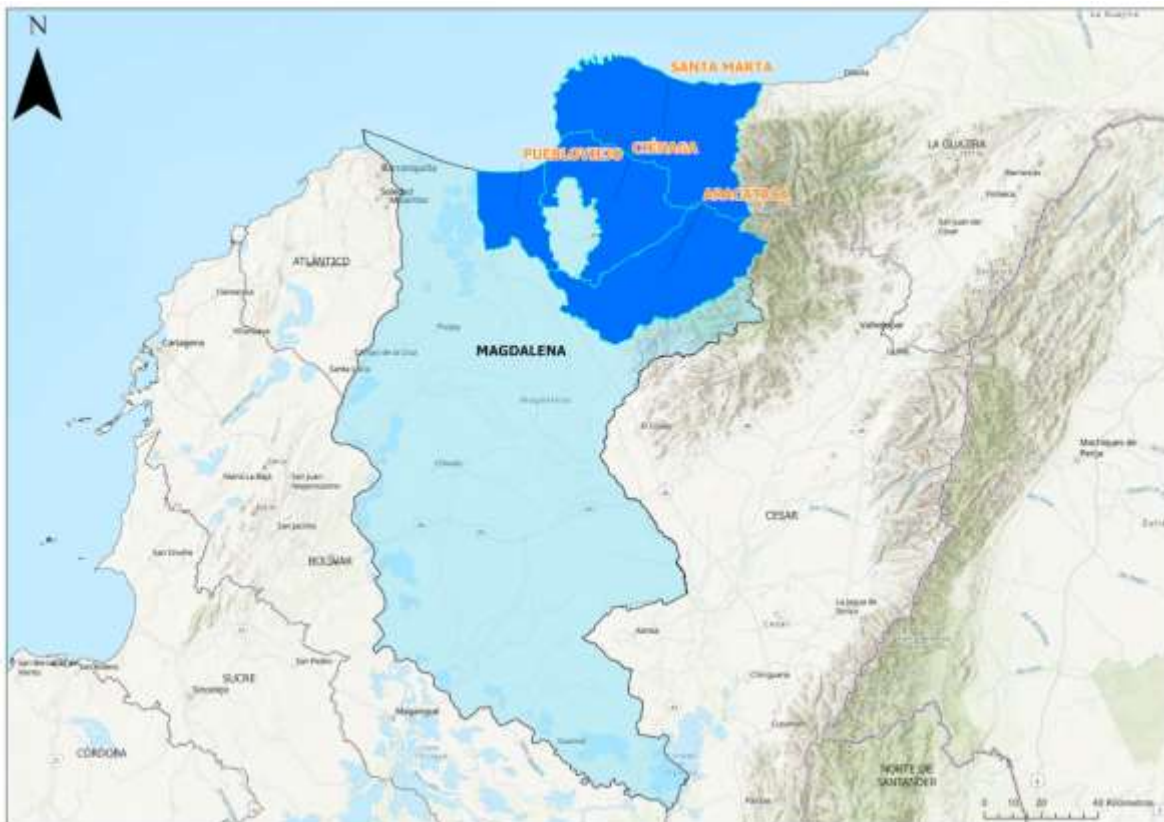
Figura 1. Distribución geográfica