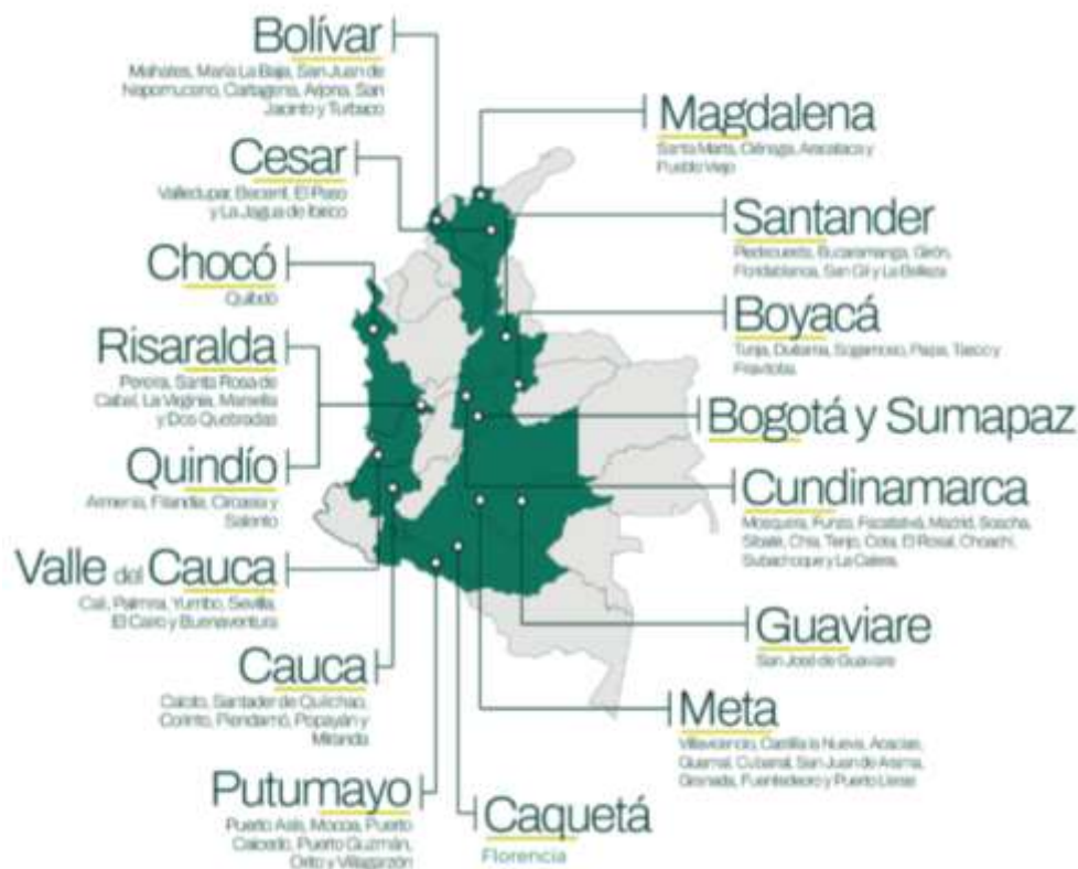
ILUSTRACIÓN 1. FIGURA INDICATIVA TERRITORIOS #ALERTAPORMIAMBIENTE 2026