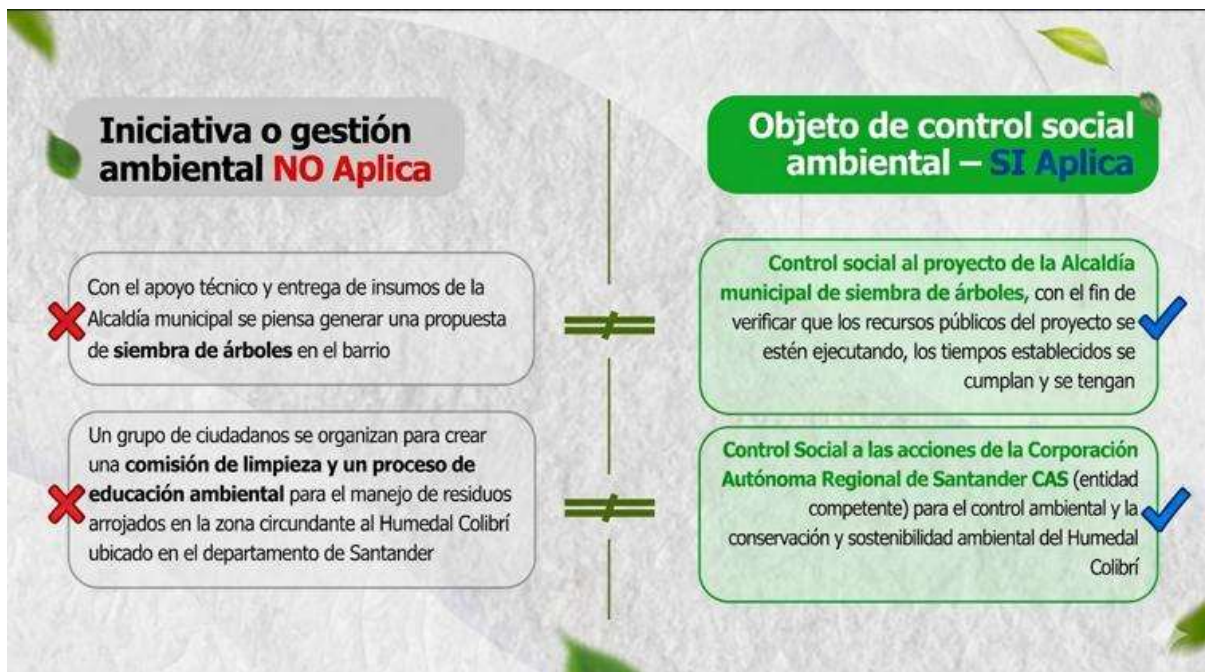
ILUSTRACIÓN 2. QUÉ ES Y QUÉ NO ES CONTROL SOCIAL