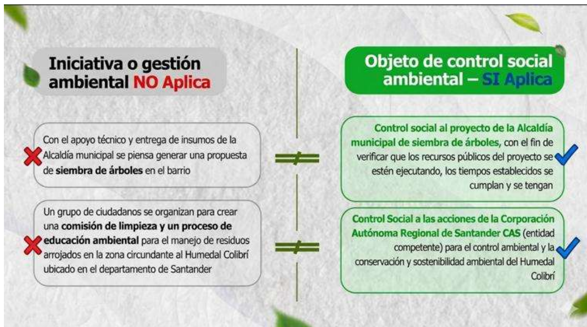
ILUSTRACIÓN 2. QUÉ ES Y QUÉ NO ES CONTROL SOCIAL