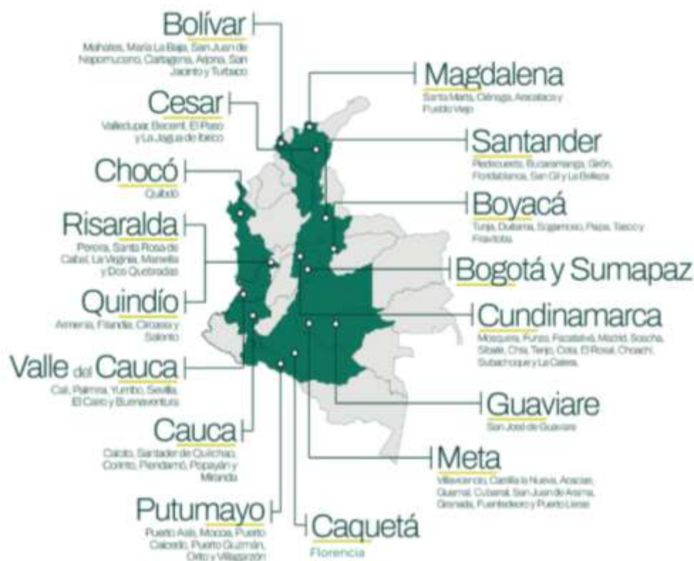
ILUSTRACIÓN 1. FIGURA INDICATIVA TERRITORIOS #ALERTAPORMIAMBIENTE 2026