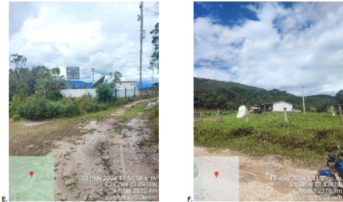
Figura 1. Registro fotográfico de la visita de campo a la RFPN Sierra El Peligro. A. Carreteable sector de Monjas. B. Aviso con el nombre de la reserva ubicado en la Escuela de Monjas. C. Señalización hacia la Quebrada Sicha Pequeña, quebrada Beltrán y quebrada La Leche. D. Señalización hacia el Alto de Los Santos, quebrada Sicha y el nacimiento de la quebrada Los Alpes. E. Vista de antenas de televisión. F. Vía terciaria en inmediaciones al sitio El Cucharo.

Se ha presentado el territorio la construcción de vías terciarias. Si bien no se logró ubicar el Camino Real, en la visita de campo se identificaron los elementos geográficos, como son la quebrada Sicha Pequeña y los límites municipales entre los municipios de Moniquirá – Arcabuco y Arcabuco – Gachantivá, que se complementaron con elementos de la cartografía básica del IGAC para definir los límites y vértices de la reserva.