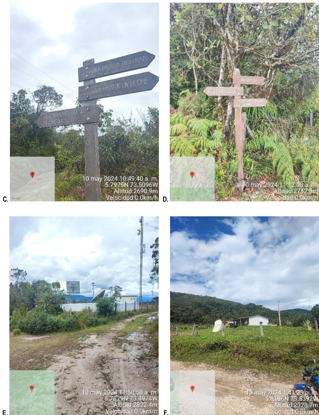
Figura 1. Registro fotográfico de la visita de campo a la RFPN Sierra El Peligro. A. Carreteable sector de Monjas. B. Aviso con el nombre de la reserva ubicado en la Escuela de Monjas. C. Señalización hacia la Quebrada Sicha Pequeña, quebrada Beltrán y quebrada La Leche. D. Señalización hacia el Alto de Los Santos, quebrada Sicha y el nacimiento de la quebrada Los Alpes. E. Vista de antenas de televisión. F. Vía terciaria en inmediaciones al sitio El Cucharo.