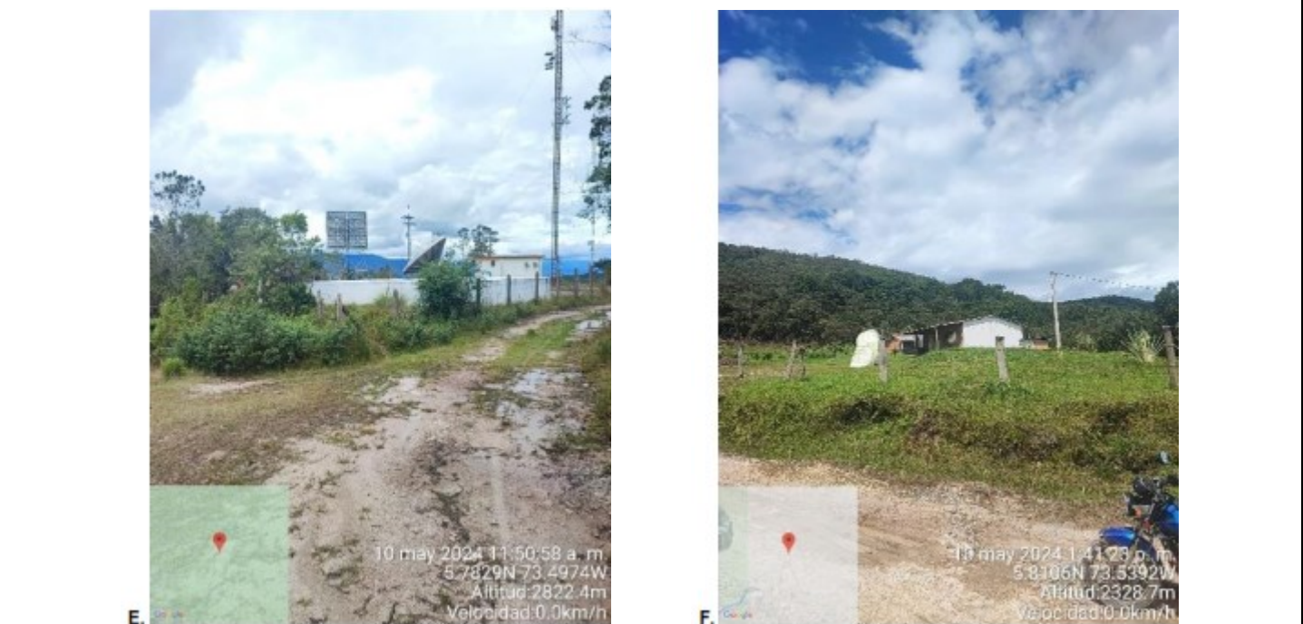
Figura 1. Registro fotográfico de la visita de campo a la RFPN Sierra El Peligro. A. Carreteable sector de Monjas. B. Aviso con el nombre de la reserva ubicado en la Escuela de Monjas. C. Señalización hacia la Quebrada Sicha Pequeña, quebrada Beltrán y quebrada La Leche. D. Señalización hacia el Alto de Los Santos, quebrada Sicha y el nacimiento de la quebrada Los Alpes. E. Vista de antenas de televisión. F. Vía terciaria en inmediaciones al sitio El Cucharo.

Se ha presentado el territorio la construcción de vías terciarias. Si bien no se logró ubicar el Camino Real, en la visita de campo se identificaron los elementos geográficos, como son la quebrada Sicha Pequeña y los límites municipales entre los municipios de Moniquirá – Arcabuco y Arcabuco – Gachantivá, que se complementaron con elementos de la cartografía básica del IGAC para definir los límites y vértices de la reserva. Además, aunque en el acuerdo de declaratoria se menciona que la reserva tiene su jurisdicción solamente en el municipio de Moniquirá, con la persona de la comunidad y los funcionarios de CORPOBOYACÁ se evidenció que la jurisdicción de la reserva se encuentra también en el municipio de Gachantivá, pues el sitio El Cucharo se encuentra en este municipio, donde también se encuentra parte de la vía terciaria que comunica a Gachantivá con Moniquirá. Además, se corroboró que la reserva no tiene jurisdicción en el municipio de Arcabuco.