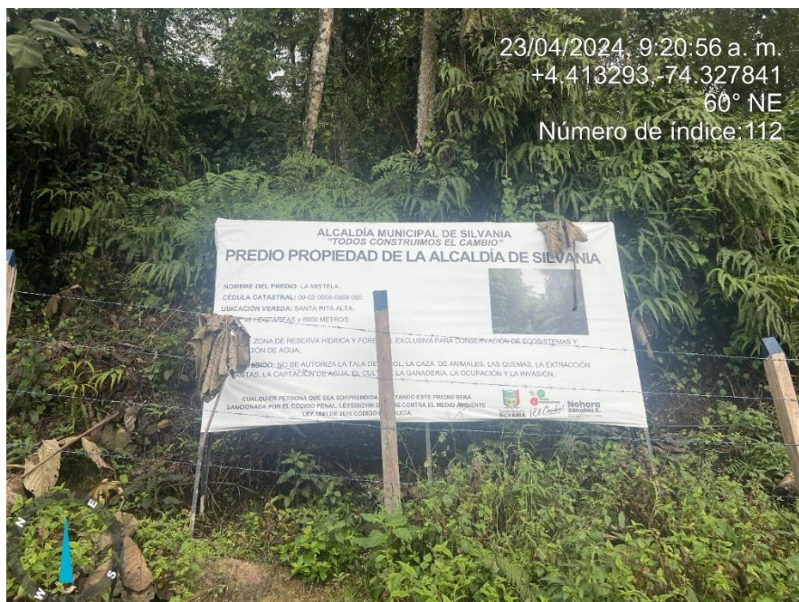
Figura 1 Inicio RFPN Mistela predio No. 4 Propiedad Alcaldía Municipal de Silvania

Adicionalmente se realizó la consulta sobre el plano número P-334-599 elaborado por el INCORA, en donde se encuentran consignados los límites descritos en el Acuerdo No. 0005 del 17 de febrero de 1992 delINDERENA aprobado mediante la Resolución Ejecutiva No. 0077 del 20 de mayo de 1992 del Ministerio de Agricultura. (Ver Figura 2 y Anexo 1).