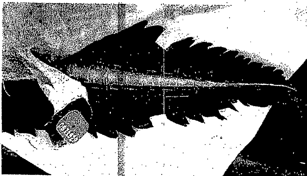
Adulteración del botón cicatrizal mediante corte de la décima escama

"Por la cual se decide un procedimiento sancionatorio y se adoptan otras determinaciones"