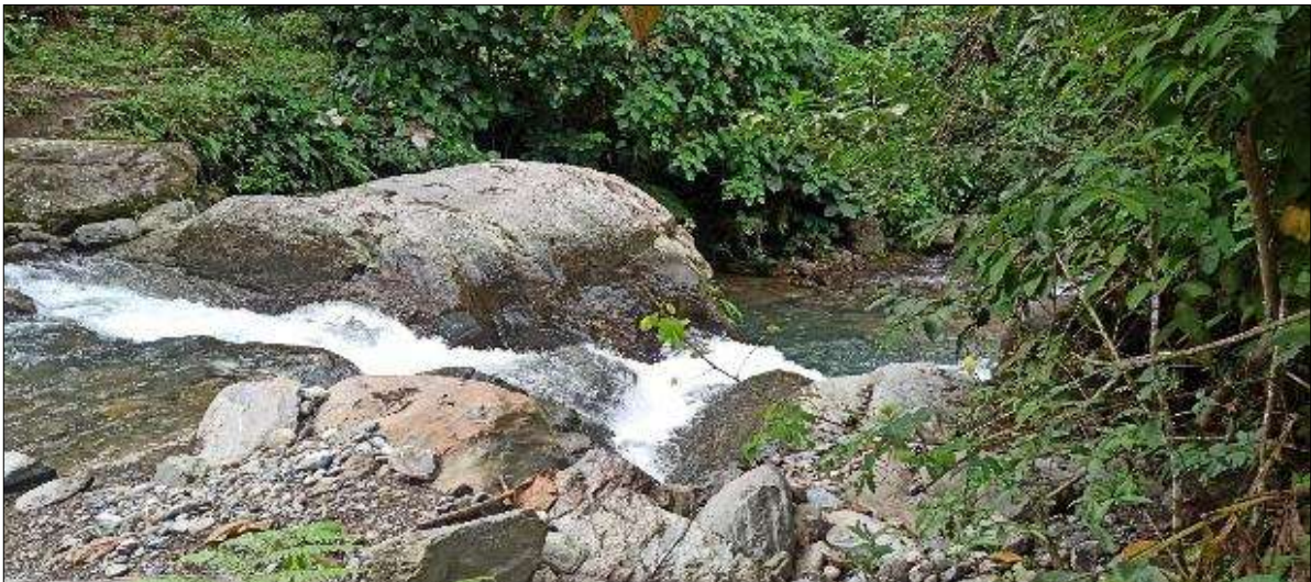
Foto 4. Vista general quebrada La Rica.

La quebrada La Rica, fuente generadora principal del proyecto hidroeléctrico, presenta en este punto específico una fuerte y pronunciada caída, salto que generaría un potencial eléctrico de 2.5MW, la quebrada La Rica posee un lecho amplio que, en periodos de alta pluviosidad, según habitantes de la zona aumenta su volumen de agua considerablemente. Cuenta con la presencia de clastos subredondeados y subangulares de gran tamaño, que permite inferir periodos de alta energía que transportan y depositan dicho material en las partes bajas. El afluente presenta aguas incoloras e inoloras y sin presencia de desechos