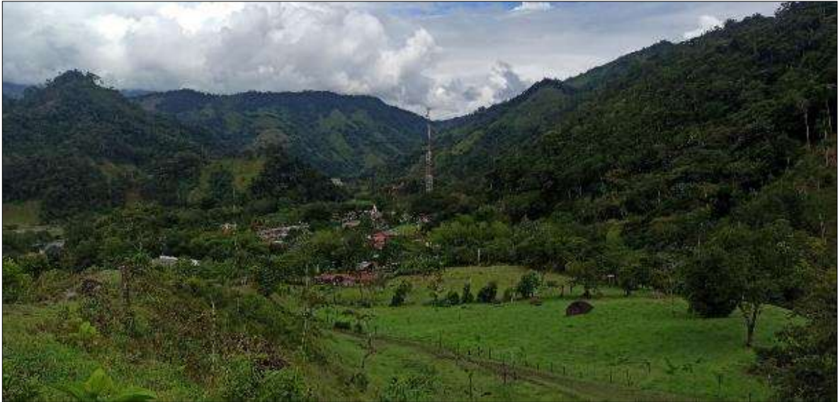
Foto 3. Vista general área de acceso zona de sustracción.

“Por la cual se efectúa la sustracción definitiva de un área de la Reserva Forestal Central y se adoptan otras disposiciones, en el marco del expediente SRF 564”