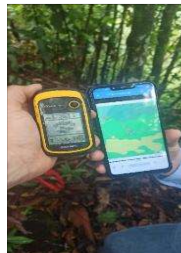
Foto 10. Zona proyectada para instalación de la tubería de conducción

Continuando el ascenso, se aleja del paisaje fragmentado agrícola forestal, para dar paso a un bosque secundario de mejor desarrollo estructural, con presencia de individuos pioneros típicos en diferentes estadios sucesionales, con predominio de especies forestales de los géneros Cecropia, Hymenaea, Jacaranda, Leucaena y Clusia. Especies como el yarumo, algarrobo, chingalé, acacia en estado juvenil, muestra el nivel de intervención antrópica producto de la explotación de madera con fines comerciales y para el suministro de leña de uso doméstico para la zona rural.