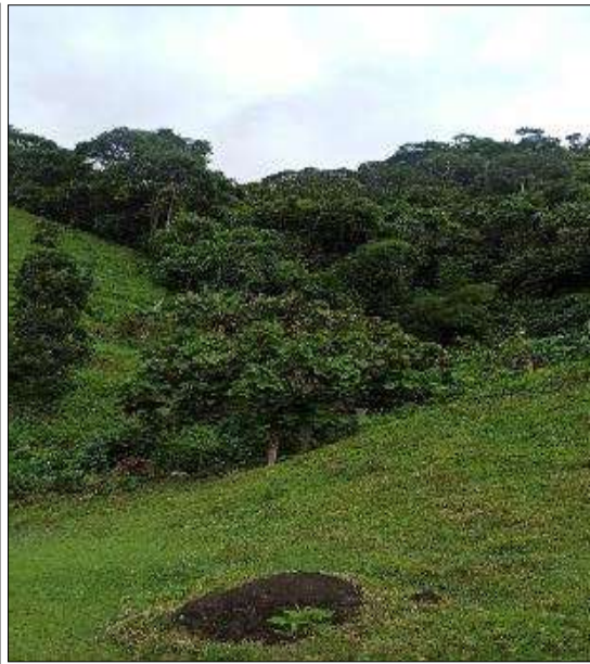
Foto 15. Zona baja proyectada para instalación de tubería