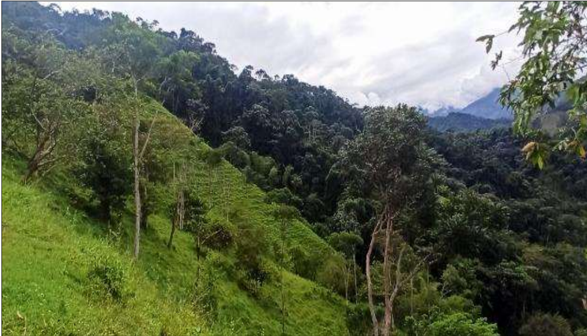
Foto 13. Vista general para instalación de las líneas de conducción de tubería

“Por la cual se efectúa la sustracción definitiva de un área de la Reserva Forestal Central y se adoptan otras disposiciones, en el marco del expediente SRF 564”