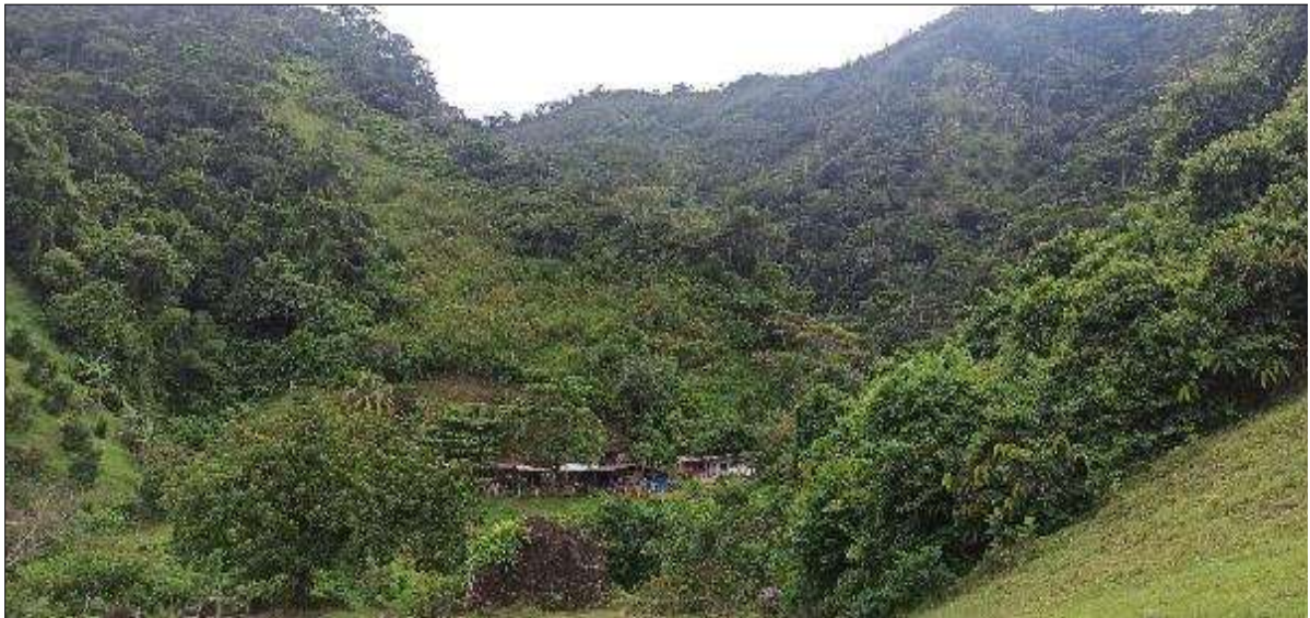
Foto 2. Zona proyectada para instalación de la casa de máquinas.

Unos metros arriba cercano a un pequeño caserío conformado por unas seis unidades habitacionales campesinas, dedicadas a la agricultura y pequeña ganadería se encuentra designado el sitio en donde se proyecta ubicar la casa de máquinas coordinadas E 4763978 N 2169325 “Origen Único Nacional”, la zona corresponde a un pequeño claro con cobertura de pastos y terreno ligeramente ondulado que da ingreso a la zona montañosa, en este mismo punto y a una distancia de 15 metros de la quebrada, se ubicaría el punto de retorno del agua que se usaría para la producción de energía.