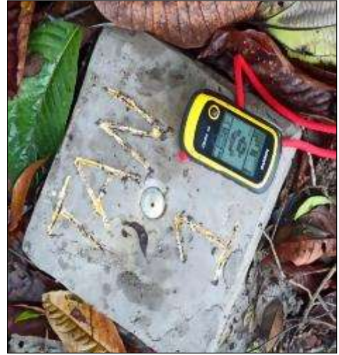
Foto 11. Zona proyectada para instalación del tanque de captación

Con el fin de obtener una panorámica general de la zona de sustracción por donde se propone la instalación de las líneas de tubería de conducción a la casa de máquinas, se programa un nuevo ascenso por el costado oriental hasta un punto en donde se obtiene una vista general del área de interés, apreciando el nivel de intervención antrópico y el grado de conservación del bosque. En cuanto a coberturas, se observa que el área solicitada en sustracción donde se generará cambio de uso para la instalación de las tuberías corresponde a una vegetación con un estado de sucesión avanzada, que se presenta densa en algunas zonas, con presencia de árboles en estado juvenil que sobresalen por su gran tamaño, pero con poco desarrollo diamétrico y zonas fuertemente intervenidas con cultivos agrícolas y pastizales al llegar a las zonas bajas en donde se pretende establecer la casa de máquinas.