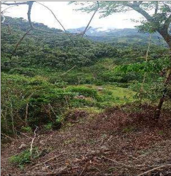
Foto 14. Zona baja proyectada para instalación de tubería