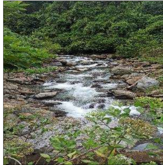
Foto 6. Vista general quebrada La Rica.

Unos metros arriba cercano a un pequeño caserío conformado por unas seis unidades habitacionales campesinas, dedicadas a la agricultura y pequeña ganadería se encuentra designado el sitio en donde se proyecta ubicar la casa de máquinas coordinadas E 4763978 N 2169325 “Origen Único Nacional”, la zona corresponde a un pequeño claro con cobertura de pastos y terreno ligeramente ondulado que da ingreso a la zona montañosa, en este mismo punto y a una distancia de 15 metros de la quebrada, se ubicaría el punto de retorno del agua que se usaría para la producción de energía.