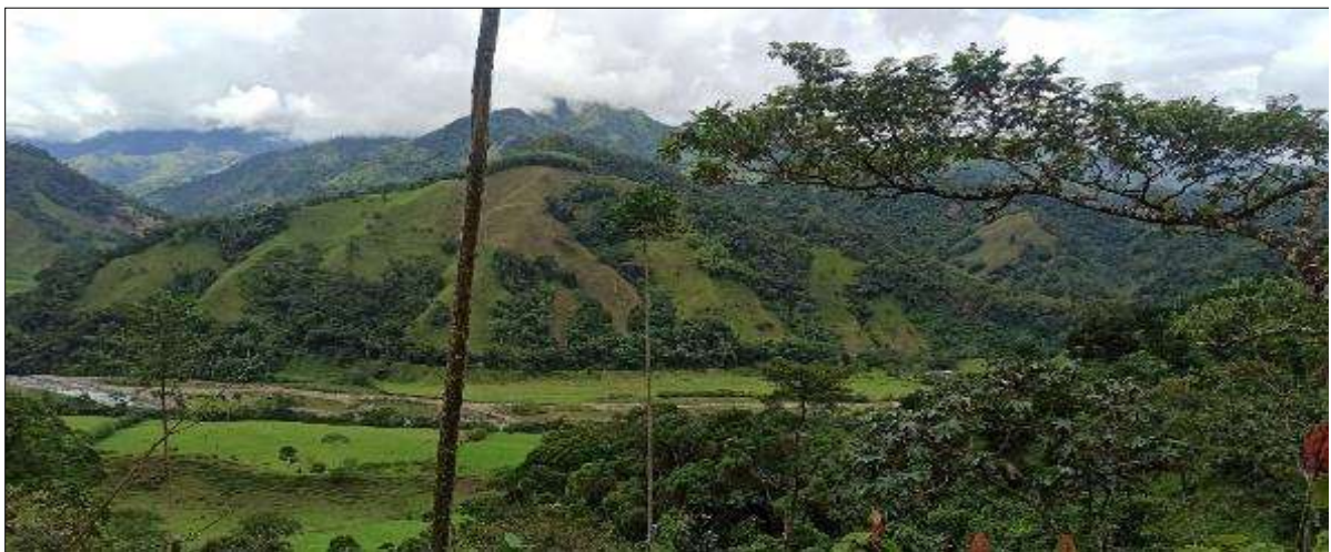
Foto 1. Paisaje regional Área de Influencia Indirecta

A nivel paisajístico regional, el área se encuentra inmersa en un paisaje de mosaico fragmentado compuesto por diferentes coberturas naturales que alternan entre áreas agrícolas, vegetación secundaria, relictos de bosque denso, y zonas de pastos, como se observa en las fotografías 1 y 2.