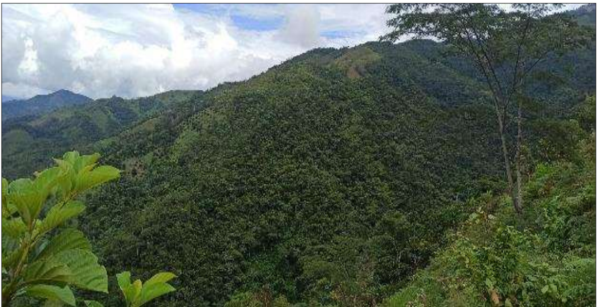
Foto 12. Vista general para instalación de las líneas de conducción de tubería

Con el fin de obtener una panorámica general de la zona de sustracción por donde se propone la instalación de las líneas de tubería de conducción a la casa de máquinas, se programa un nuevo ascenso por el costado oriental hasta un punto en donde se obtiene una vista general del área de interés, apreciando el nivel de intervención antrópico y el grado de conservación del bosque. En cuanto a coberturas, se observa que el área solicitada en sustracción donde se generará cambio de uso para la instalación de las tuberías corresponde a una vegetación con un estado de sucesión avanzada, que se presenta densa en algunas zonas, con presencia de árboles en estado juvenil que sobresalen por su gran tamaño, pero con poco desarrollo diamétrico y zonas fuertemente intervenidas con cultivos agrícolas y pastizales al llegar a las zonas bajas en donde se pretende establecer la casa de máquinas.