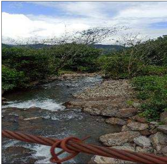
Foto 5. Quebrada La Rica.

“Por la cual se efectúa la sustracción definitiva de un área de la Reserva Forestal Central y se adoptan otras disposiciones, en el marco del expediente SRF 564”