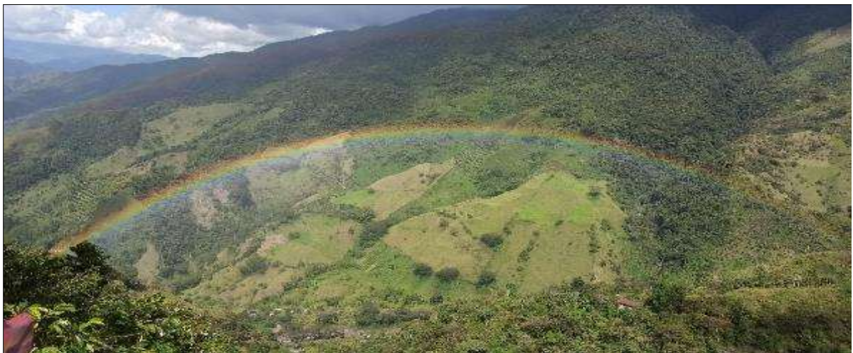
Foto 2. Paisaje regional Área de Influencia Indirecta

El área de interés para el proyecto, por su parte se ubica en el corregimiento de Pueblo Nuevo, municipio de Pensilvania, al área de sustracción se accede caminando desde el centro poblado por camino carreteable que conduce al puesto de policía. No obstante, y según se indica por parte del personal de PROICOM, a partir de este punto el acceso deberá ser ampliado y mejorado para facilitar el ingreso de la maquinaria que transportará los materiales para la construcción e instalación de la infraestructura de la PCH. El camino que será ampliado y el área donde se plantea implementar el nuevo acceso de pueden observar en la siguiente vista general panorámica.