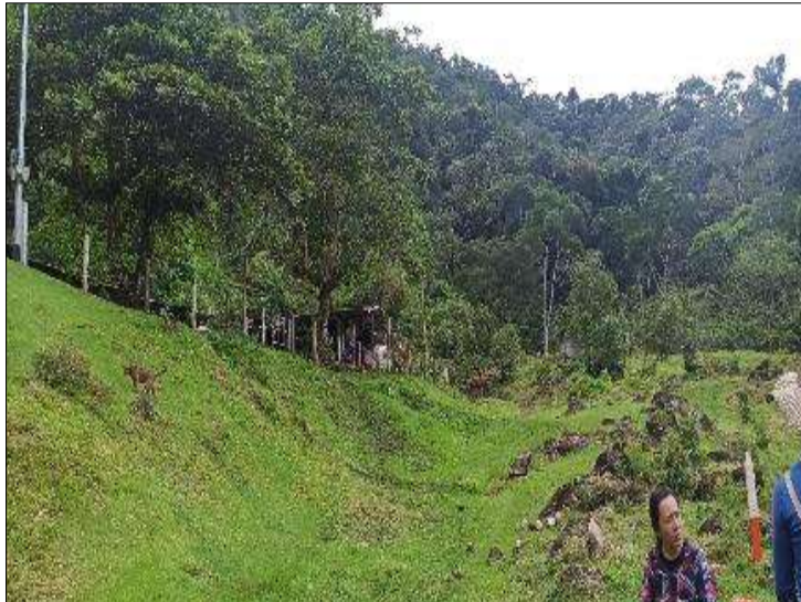
Foto 8. Zona proyectada para instalación de la casa de máquinas.

“Por la cual se efectúa la sustracción definitiva de un área de la Reserva Forestal Central y se adoptan otras disposiciones, en el marco del expediente SRF 564”