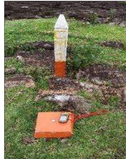
Foto 9. Futura casa de maquinas

Se inicia recorrido por zona montañosa altamente pendiente, siguiendo la línea de diseño por donde se proyecta la instalación de la tubería de conducción, con el fin de tener un reconocimiento directo de la zona solicitada para sustracción, y evaluar el cambio sobre el uso del suelo que el proyecto pudiera generar sobre la Reserva. Se aprecia vegetación típica del bosque secundario, producto de la intervención producida en la zona por temas agrícolas y la explotación del bosque con fines madereros.