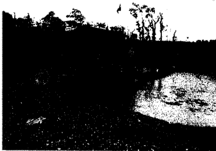
Foto 1 Actividad Minera Mecanizada en el Cauce del Río Managrú

1. Ocupación del cauce del río, incumplimiento el Decreto 1541 de 1.978 (De las Aguas no Marítimas) en su artículo 361, literal f "Explotación minera y tratamiento de minerales", ver fotográfica No. 01 a 0.