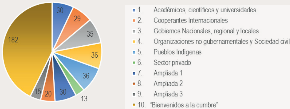
Figura 1. Distribución de participantes en los grupos de trabajo de la Reunión Técnico-Científica de la Amazonia