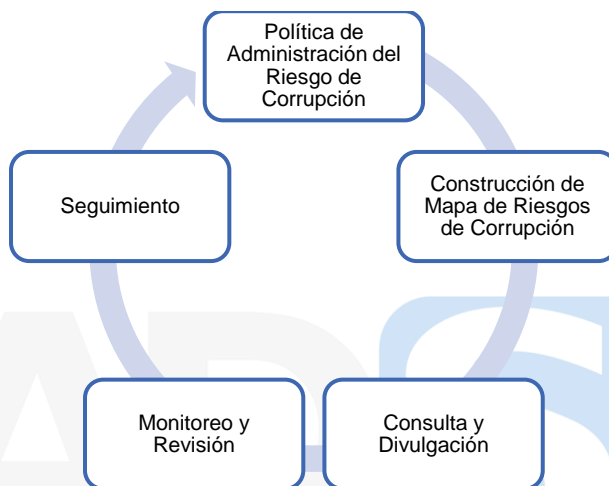
Ilustración 1. Subcomponentes Estrategia de Gestión del Riesgo de Corrupción.