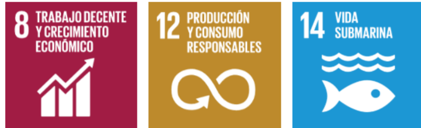
Ilustración 1. Objetivos Desarrollo Sostenible relacionados con el pacto por el emprendimiento Fuente: PND 2018 – 2022.

A su vez, contiene los lineamientos e iniciativas del Plan Sectorial de Turismo 2018-2022, con sus seis líneas estratégicas.