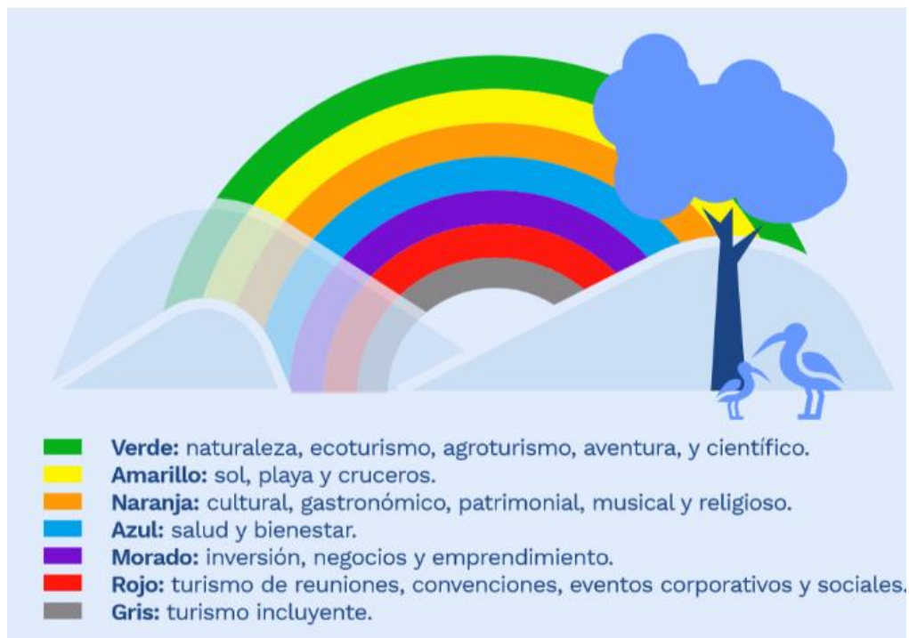
Ilustración 2. Fortalecimiento de la oferta turística en el país

Con estas iniciativas el gobierno nacional busca que el sector turismo contribuya a mejorar la competitividad del país, insertándose en el mercado internacional como un destino innovador, diverso y de alto valor, bajo principios de sostenibilidad, responsabilidad y calidad 19 .