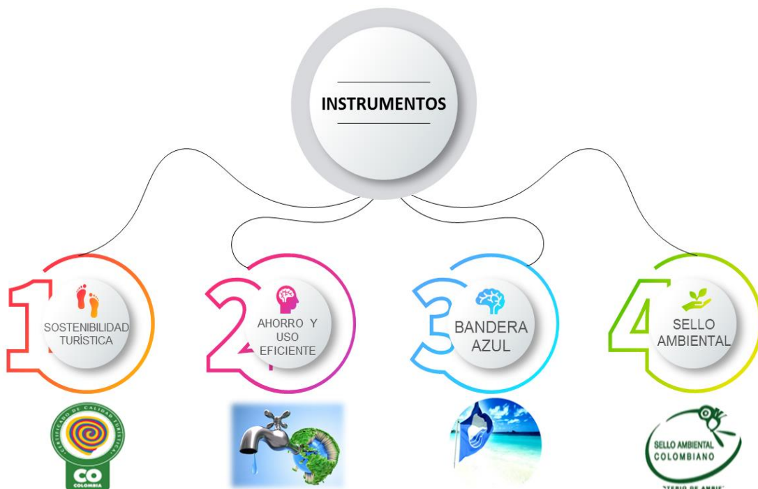
Ilustración 6. Instrumentos de sostenibilidad turística en Colombia