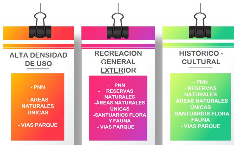
Ilustración 5 Zonas de manejo para la recreación

En el año 2013 y con apoyo de la cooperación técnica internacional entre Finlandia y Colombia, Parques Nacionales Naturales de Colombia publicó la Guía para la planificación del Ecoturismo en Parques Nacionales Naturales de Colombia 26 . La guía establece criterios para la zonificación relacionada con el ecoturismo , definidos con el fin de lograr los objetivos de conservación propuestos, la persistencia y la protección de los valores que son objetos de conservación; definiendo zonas que permiten cumplir con la misión del área protegida tal y como se evidencia en el siguiente esquema: