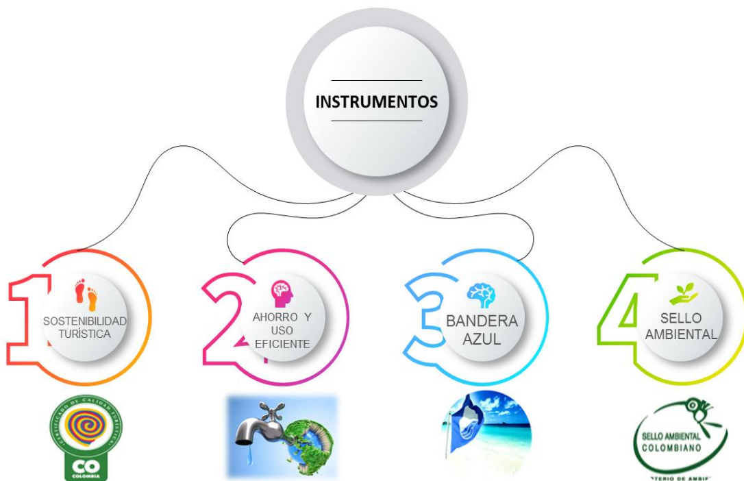
Ilustración 6. Instrumentos de sostenibilidad turística en Colombia