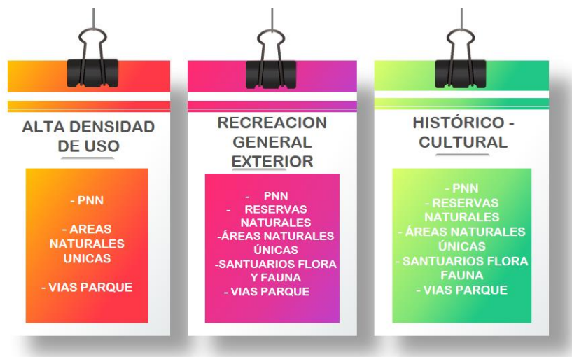
Ilustración 5 Zonas de manejo para la recreación

En el año 2013 y con apoyo de la cooperación técnica internacional entre Finlandia y Colombia, Parques Nacionales Naturales de Colombia publicó la Guía para la planificación del Ecoturismo en Parques Nacionales Naturales de Colombia 26 . La guía establece criterios para la zonificación relacionada con el ecoturismo , definidos con el fin de lograr los objetivos de conservación propuestos, la persistencia y la protección de los valores que son objetos de conservación; definiendo zonas que permiten cumplir con la misión del área protegida tal y como se evidencia en el siguiente esquema: