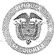
MINISTERIO DE AMBIENTE Y DESARROLLO SOSTENIBLE TABLA 6. COORDENADAS ÁREA 6- HUMEDAL CHIQUEROS