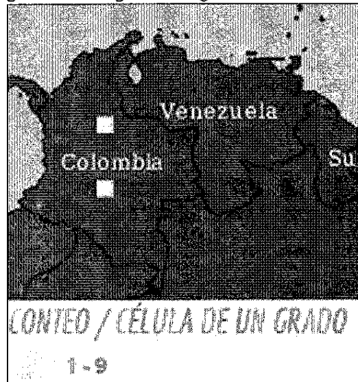
Figura 1. Registros Biológicos del género Bromelia en Colombia

Según los registros biológicos para el género Bromelia , en Colombia solo se han encontrado cinco registros biológicos, en las inmediaciones de la Serranía de la Macarena, y en el Departamento de Santander, Municipio de Suaita (Figura 1), sin embargo se denota la ausencia de registros específicos para Bromelia chrysantha .