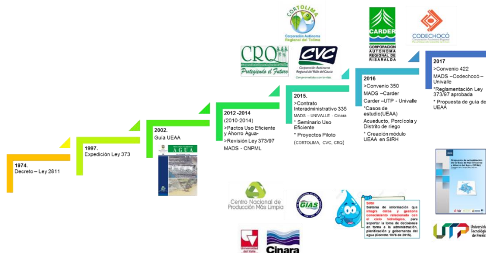
Figura 2. Marco normativo y de política en relación al UEAA