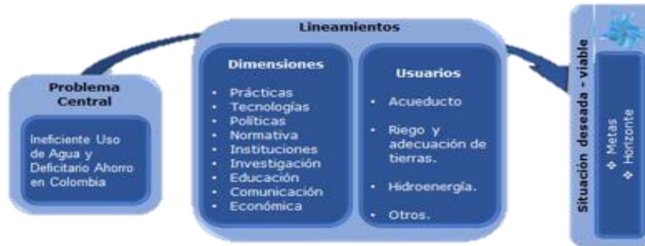
Figura 4. Esquema para la identificación de los lineamientos para la promoción del UEAA.

En el contexto de los problemas asociados al UEAA se presentan aquellas características que actualmente tiene el país con relación al agua, fundamentalmente desde su oferta y demanda. Una síntesis se presenta en la Tabla 9, acorde con el ENA, 2014, la PNGIRH (2010-2022) y el Plan de Acción de lucha Contra la Desertificación y Sequías (2005-2020). Estos problemas se identificaron desde cada una de las dimensiones: institucional, normativa, política, socio – cultural, técnico- científica, el análisis detallado se encuentra en los informes técnicos de los convenios y contratos adelantados por el Minambiente.