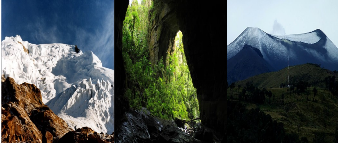
Parques Nacionales Naturales : Nevado del Huila, Cueva de los Guacharos , Purace.