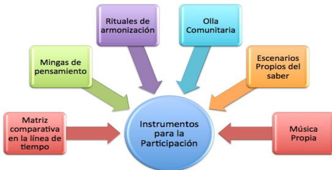
Figura 4: Algunos instrumentos para la estrategia de participación