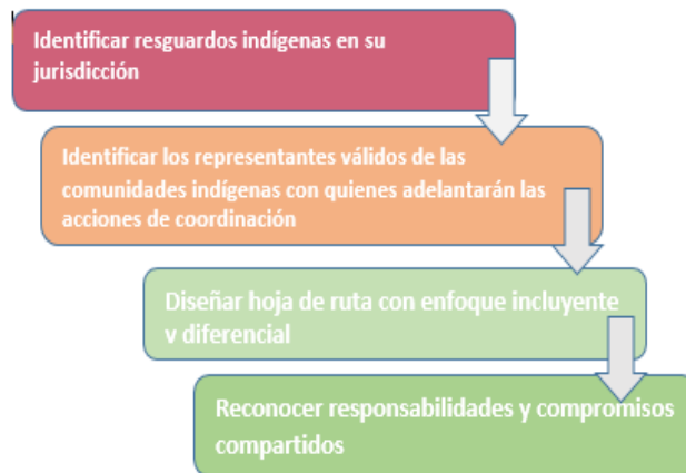
Figura 3. Etapas de la estrategia de coordinación

Las CAR, deben identificar los representantes válidos o líderes oficiales de los pueblos indígenas con quienes adelantarán las acciones de coordinación. De un lado, existen los cabildos, los cuales están conformados por representantes elegidos por la comunidad normalmente para un período de un año. Los cabildos tienen a su cargo el relacionamiento con los actores externos al resguardo, siendo sus gobernadores los representantes políticos válidos para la negociación y concertación de diferentes asuntos que les afectan. De otro lado, existen las denominadas autoridades tradicionales, en las que destacan los mayores , los sabedores y los médicos tradicionales . Estos gozan de legitimidad ante la comunidad y son quienes, frecuentemente, tienen mayor influencia en la toma de decisiones que atañen a la comunidad. Se puede dar el caso que las autoridades tradicionales a su vez ocupen cargos en los cabildos. Las CAR, deben prestar especial atención en la identificación de unos y otros líderes, ya que estos actúan como bisagras en la comunicación entre las autoridades ambientales y los pueblos indígenas y sirven como difusores ante la comunidad de los acuerdos de coordinación alcanzados con las autoridades ambientales remediando, de existir, inconvenientes producto de la diversidad lingüística de los pueblos indígenas.