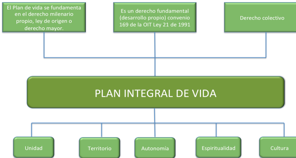
Figura 5: Marco conceptual del plan integral de vida indígena