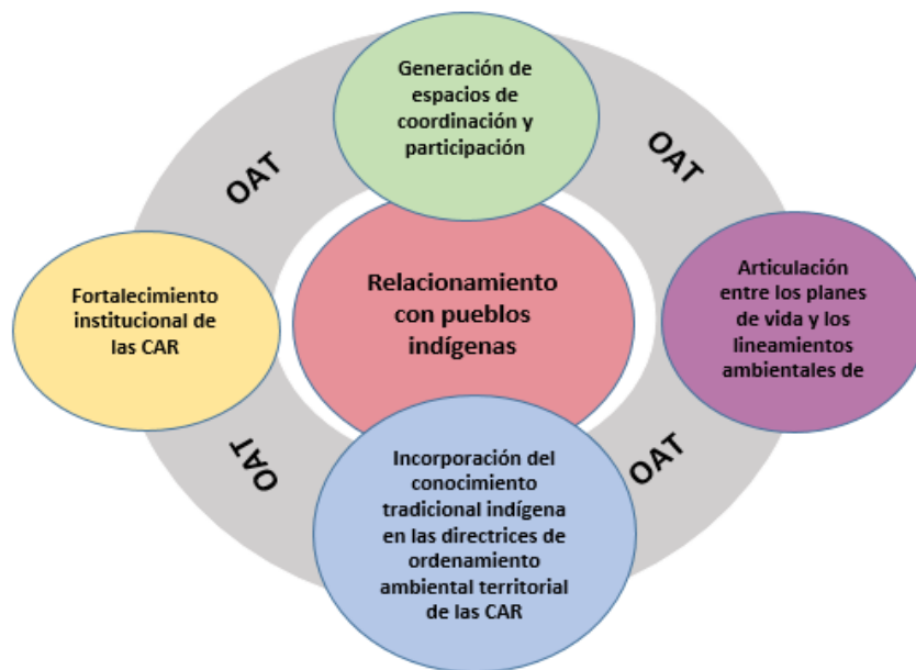
Figura 1. Criterios orientadores para el relacionamiento de las corporaciones autónomas regionales y de desarrollo sostenible con los pueblos indígenas en procesos de ordenamiento ambiental territorial

*OAT: ordenamiento ambiental territorial