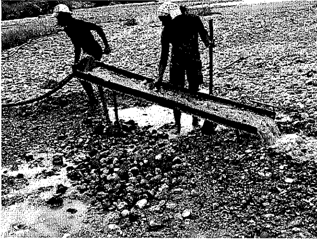
Fotografía 4. Extracción artesanal